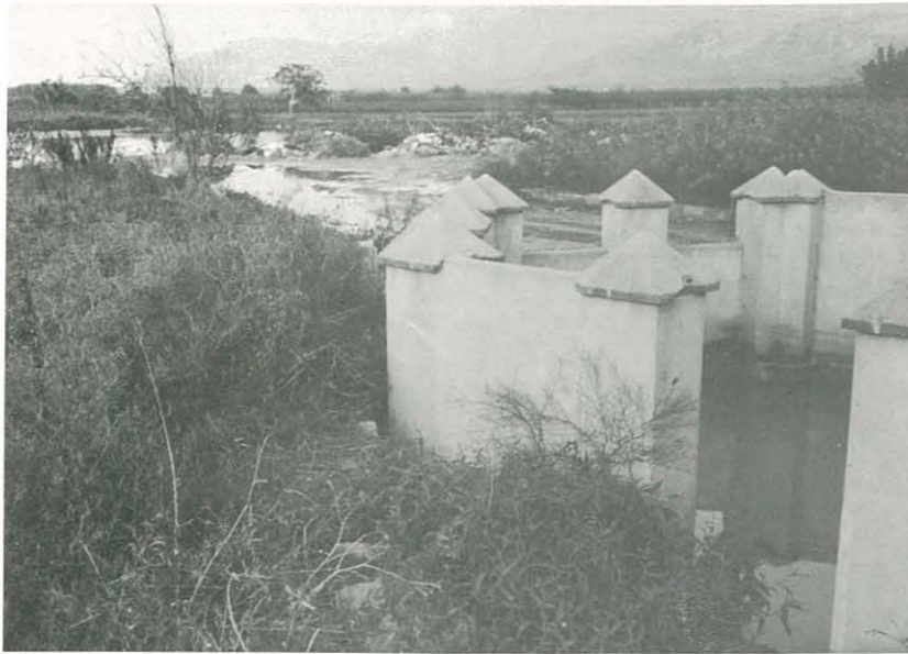
Estado actual y deplorable del Aubelló.

Desde esta información damos el grito de alarma y censuramos a los responsables del abandono y de las posibles consecuencias que pueda sufrir el histórico Aubelló, único en España.