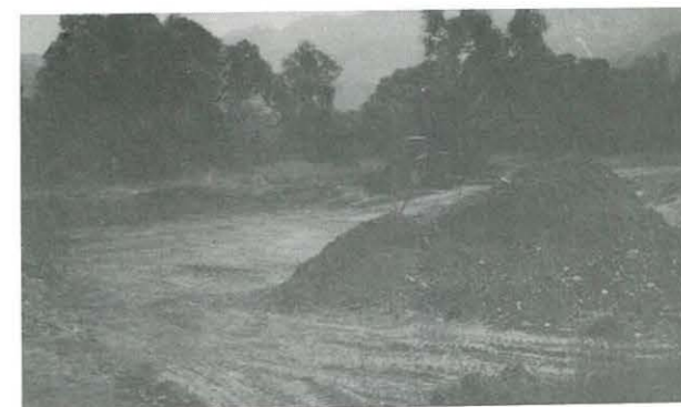
Las tanquetas siguen profundizando en la tierra.

Nuestra publicación, LIBRE E INDEPENDIENTE, tiene la misión de informar, con claridad y veracidad, a sus lectores y a todos los vecinos y contribuyentes, para que sepan como se gastan sus dineros.