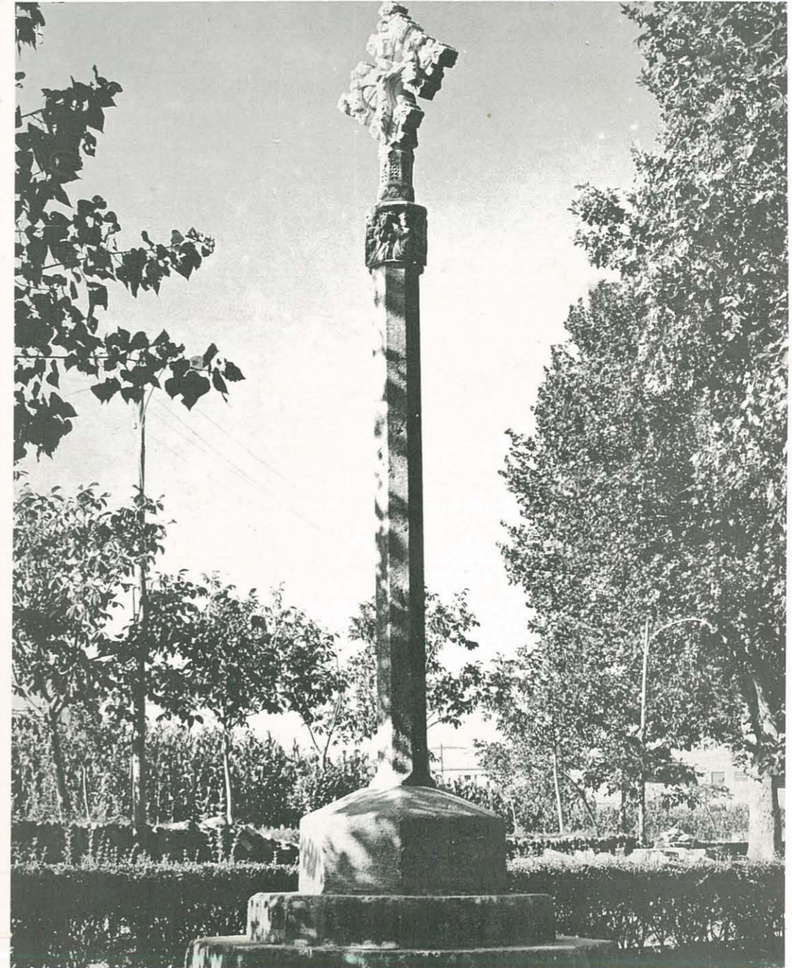
HISTORICA Y VALIOSA CRUZ DE TERMINO, ADMIRADA POR NUESTROS ANTEPASADOS Y POR TODOS LOS HIJOS DE LA VILLA DE ULLDECONA QUE, CON ALTO HONOR, FUE REPRODUCIDA Y EXPUESTA EN EL RECINTO DEL PUEBLO ESPAÑOL DE BARCELONA, EXPOSICION INTERNACIONAL DEL AÑO 1929.