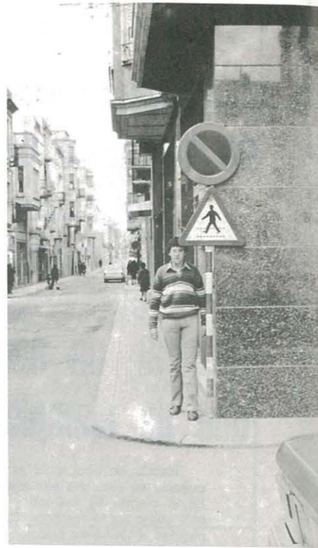
Unas señales para enanos y buenos chichones, en la calle y plaza Mayor.

Parece obra de un demente, no se puede calificar será un matadero de gente ¿conocéis mayor barbaridad?